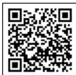
ビジターセンター ホームページ