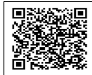
ビジターセンター Instagram